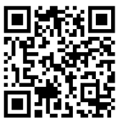
Odstavná plocha VT Jince